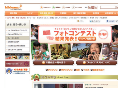
フォトコンテストページ

キャンペーンをすべてスパイラル®で構築できるのは非常にありがたいです。現在は毎月キャンペーンを実施していますが、おかげさまで会員数が順調に増えています。キャンペーンサイトのデザインは専門業者に頼んでいますが、キャンペーンシステムの構築は毎回ベースとなるシステムがあるため、コストも抑えられています。