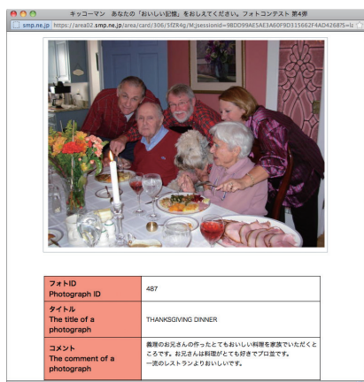
フォトコンテスト投稿作品 公開ページ

また、業務負荷の削減だけでなく、フォトコンテストの仕組みの構築にかかるコストも全体で従来の2/3ほどになりました。